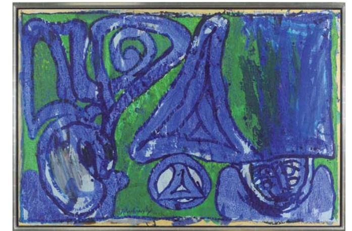
Pierre Alechinsky "Blue Note" - 1969 - acrilico su carta intelata - cm 100x153

L'8 novembre 1948 i membri del "Centre surréaliste-révolutionnaire en Belgique" (Christian Dotremont, Joseph Noiret), quelli del "Gruppo sperimentale olandese" (Karel Appel, Constant, Corneille) ed un membro del "Gruppo sperimentale danese" (Asger Jorn), redigono nell'hotel "Notre Dame" di Parigi un manifesto, che diverrà il documento fondamentale del gruppo Cobra. Gli artisti sono a Parigi per un congresso di arte surrealista, ma ai dibattiti infruttuosi preferiscono la fondazione di una comunità internazionale di artisti. L'artista e poeta belga Dotremont inventa poco dopo l'acronimo CoBrA,