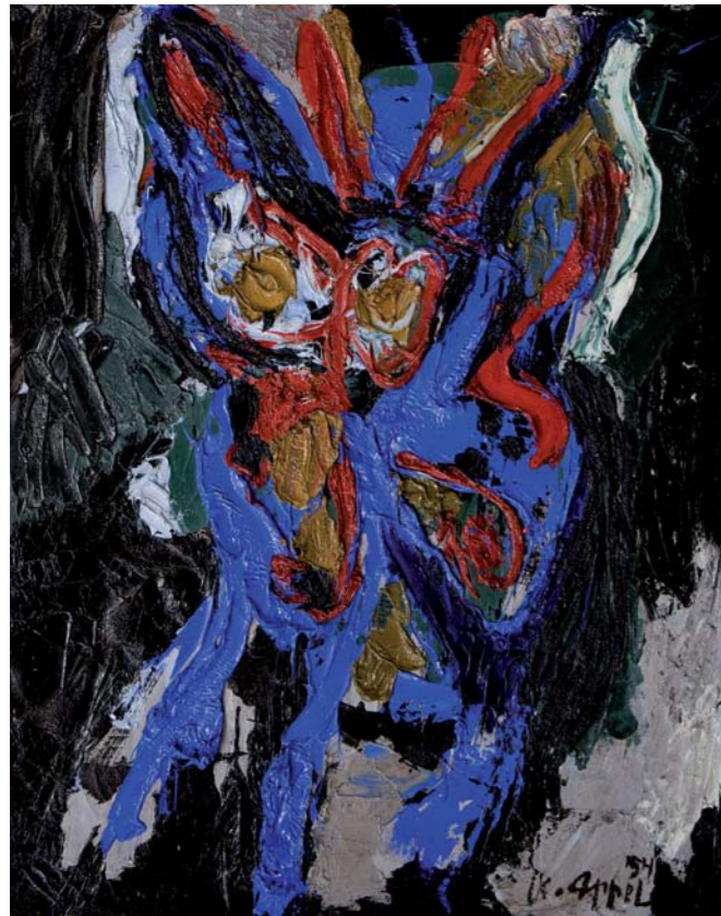
Karel Appel "Senza titolo" - 1954 - olio su tela - cm 81,3x64,8

Alla fine della seconda guerra mondiale, un irrequieto drappello internazionale di artisti si aggregò per dar vita