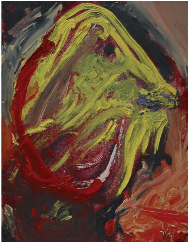
Asger Jorn "Le Bâtard" - 1960 - olio su tela - cm 35x27

formato dalle iniziali delle capitali dei paesi di provenienza dei suoi membri - Copenhagen, Bruxelles, Amsterdam - e che, allo stesso tempo, fa associare al proprio nome l'immagine del serpente velenoso. E' l'inizio di un vivace scambio internazionale di idee, teorie, opere ed esperienze personali, che caratterizzeranno il gruppo in continua crescita nei tre anni successivi, fino al suo scioglimento ufficiale nel novembre del 1951. Il gruppo si espande velocemente, riunendo in un circolo internazionale gli artisti, tra i quali vanno citati in particolare i belgi Pierre Alechinsky, Pol Bury e Serge Vandercam, gli olandesi Eugène Brands, Lucebert, Anton Rooskens e Theo Wolvekamp, i danesi Else Alfelt, Mogens Balle, Egill Jacobsen, Carl-Henning Pedersen,